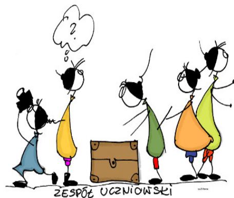
Rys. Danuta Sterna