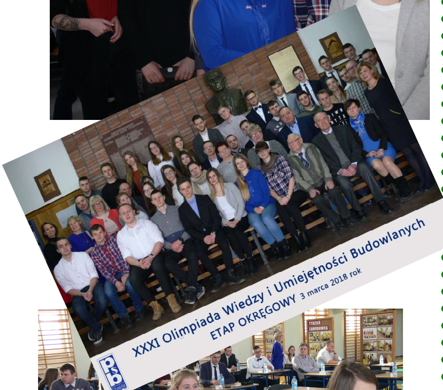
XXXI Olimpiada Wiedzy i Umiejętności Budowlanych ETAP OKRĘGOWY 3 marca 2018 rok